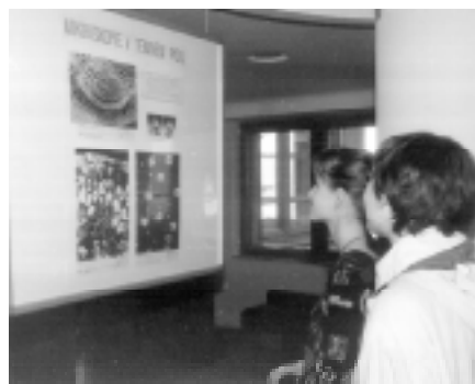
Snímkem T. Jemelky se vracíme k nedávno proběhlé vědecko-didaktické výstavě Buňka v biologii a medicíně.